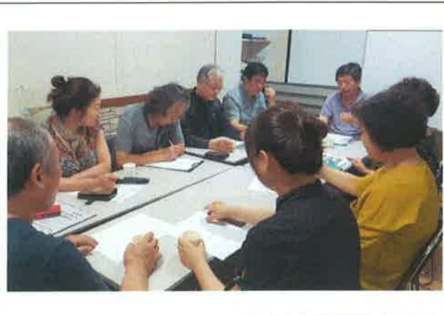
7월 수강 과목 선정 회의