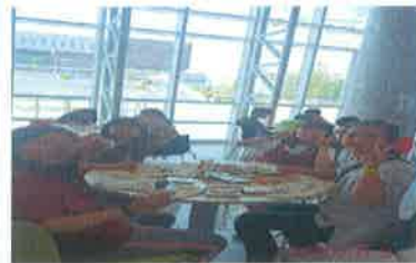
가족프로그램 -상하수도과학관 6.5.(화) 11~13시 서울하수도과학관