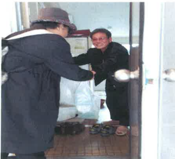
안부확인 및 반찬 전달