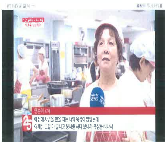
CJ헬로비전 방송 상영