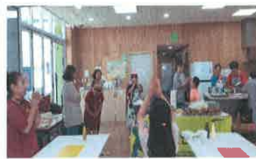
가족프로그램 - 발달장애가족과 함께 가족요리 프로그램 11~13시