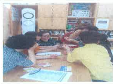
소모임: 책먹는 여우 가족봉사단 전래놀이 수료식 - 생태활동가 양성과정 격주1,3 수요일