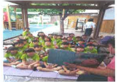
소모임: 책먹는여우가족봉사단 전래놀이 및 책읽기 실습 - 1,3세대 만남의 놀이터