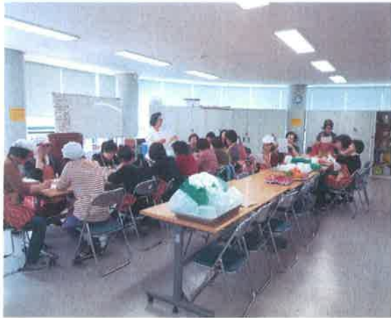
노노케어 반찬 강습