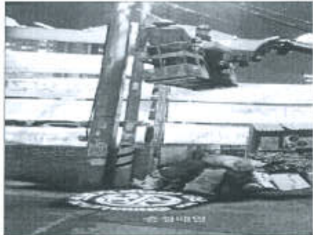
고보라이트 사례(청주시 서원구 사창동)