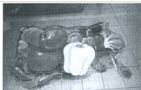
무단투기 근절을 위한 바닥 벽화