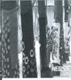
직물형 나무 광고