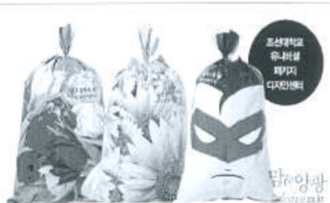
미관을 고려한 쓰레기 봉투