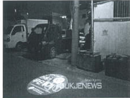
고보라이트 사례(대구시 서구청)