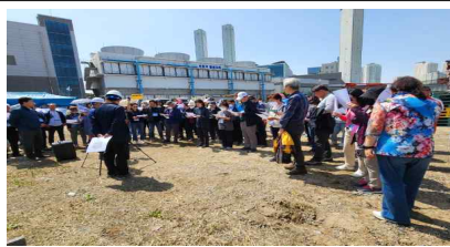
광역자원순환센터 건축현장 설명