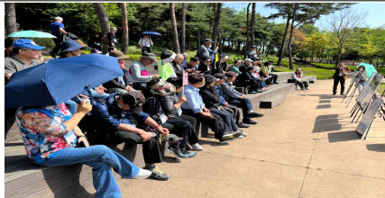
국립한글박물관 건립지 설명