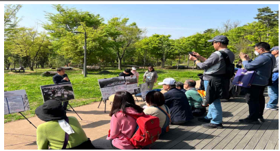
은평예술마을 조성지 설명