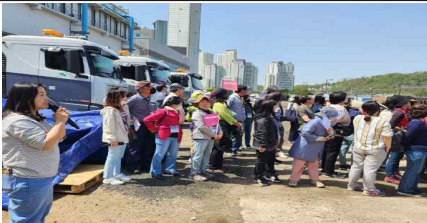
도시안전 종합시설 부지 현장