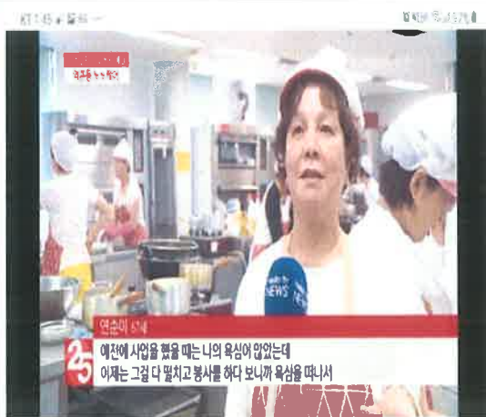
CJ헬로비전 방송 상영