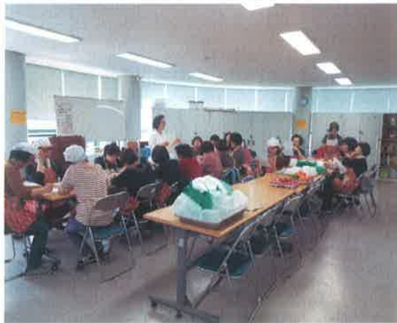
노노케어 반찬 강습