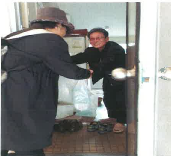
안부확인 및 반찬 전달