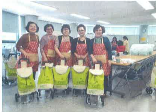
노노케어 방문 나가기 전