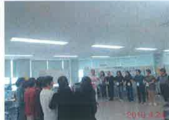
소모임: 책먹는여우가족봉사단 - 전래놀이지도자 양성과정(고누, 전래놀이) 4.10./4.24.