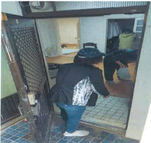
안부확인 및 반찬 전달