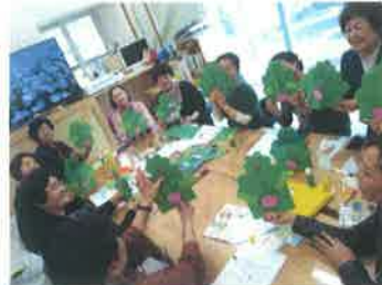
소모임: 책먹는 여우 가족봉사단 - 생태체험 및 생태활동가 양성과정(em비누, 개구리팝업북)