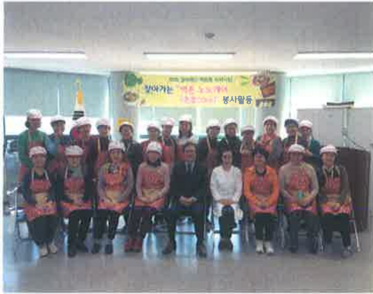
노노케어 발대식 개최