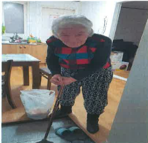
안부확인 및 반찬 전달